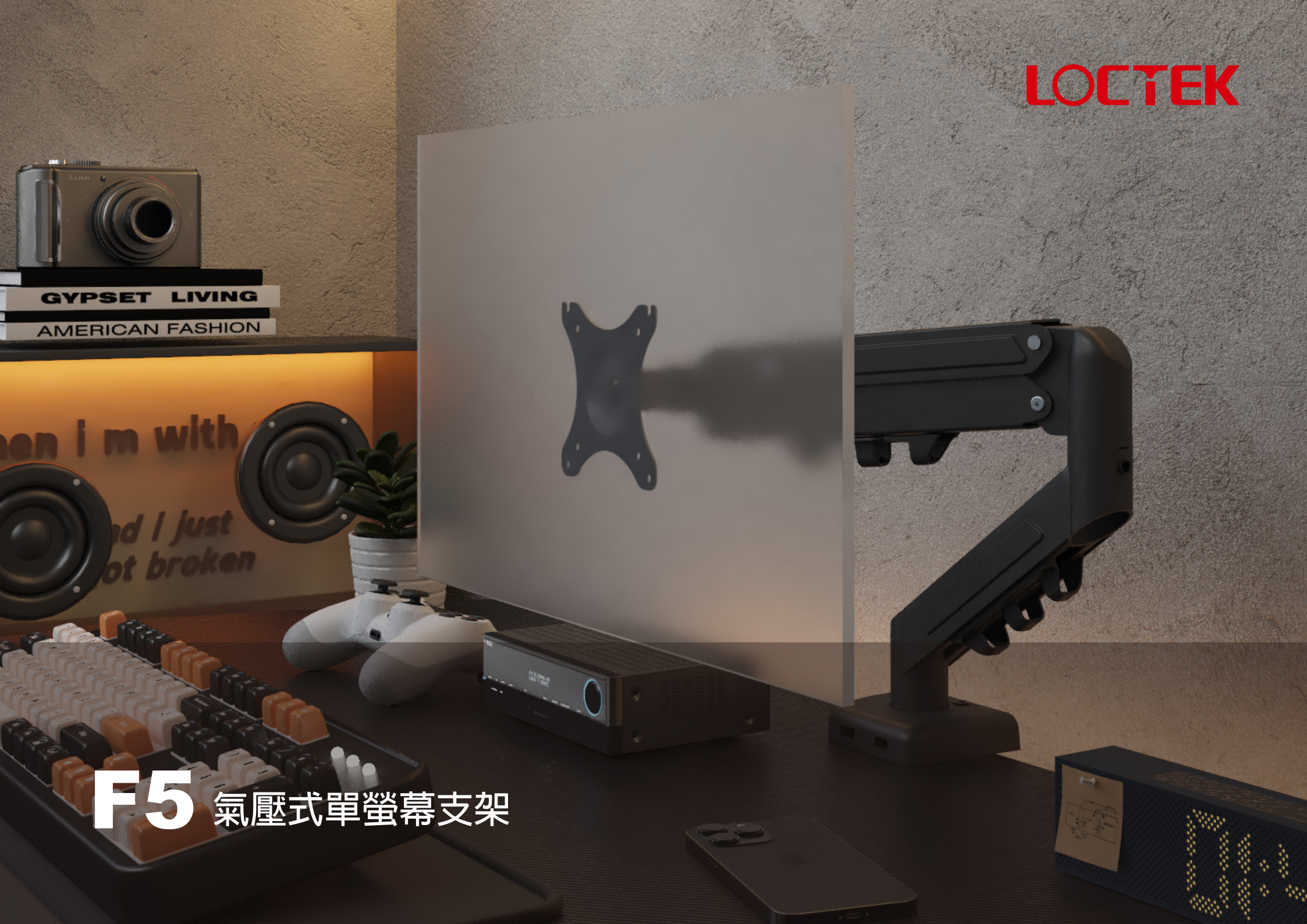
F5 氣壓式單螢幕支架